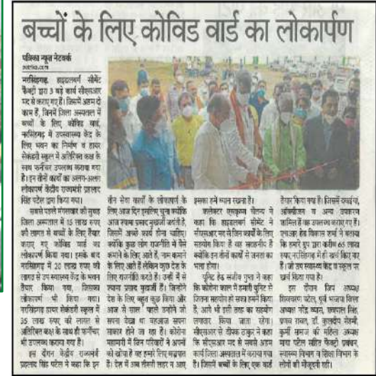
COVID ward for children