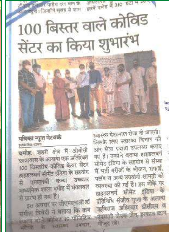
100 Beds provided to develop COVID centre to District Hospital, Damoh.